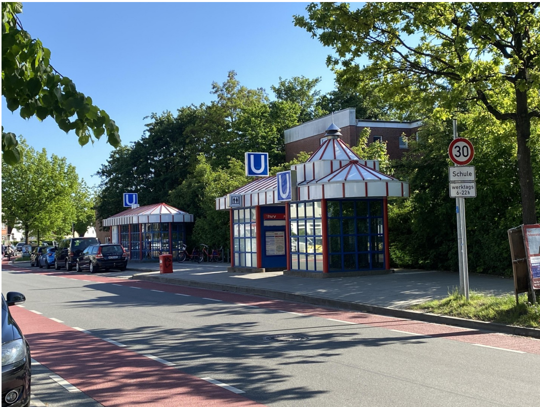
U-Bahn direkt vor dem Haus